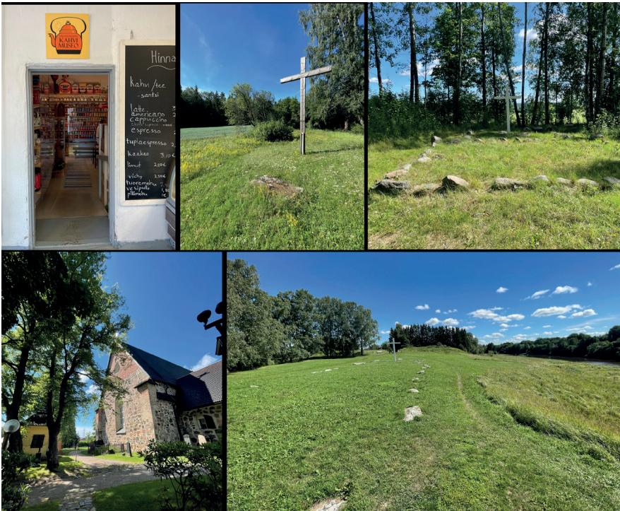
Kuva 5. Turkuun saavuin pikkuisen ja viehättävän kahvimuseon, Ristinpellon, Ravattulan Ristinmäen, Maarian keskiaikaisen kirkon ja sitä edeltäneen Koroistenniemen piispankirkon raunioiden kautta.

Tarkoitukseni oli pyöräillä illaksi Ruissaloon leirintäalueelle nukkumaan makeasti. Kilometrit kohteeseen hupenivat ja olin jo lähes perillä (14 km). Kunnes yllättäen, hieman korkeampaa rotvallia ylittäessäni se sitten tapahtui: KATASTROFI. Tunsin, että takarenkaani jarrutti yllättäen rajusti. Ensín