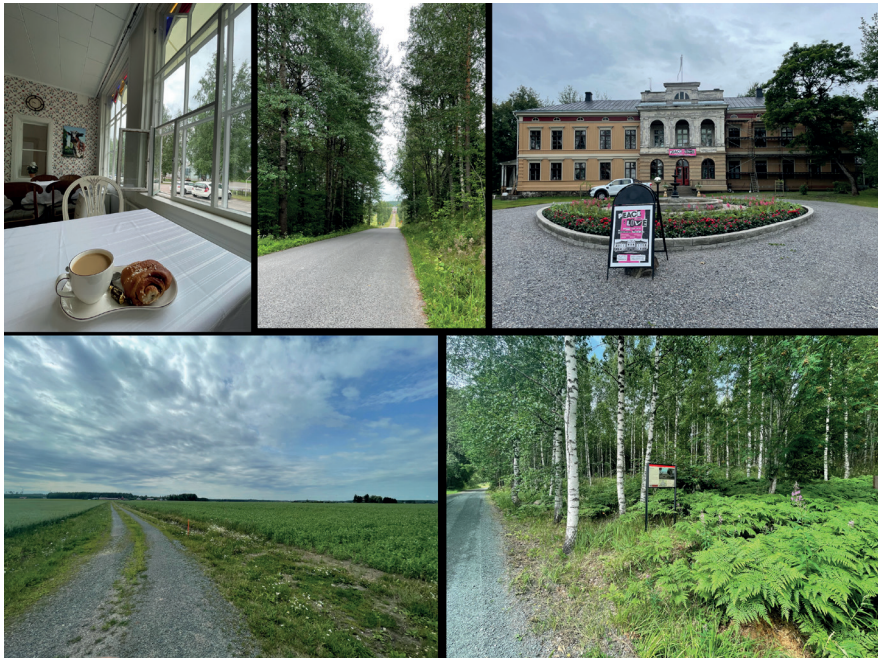
Kuva 2. Urjalasta matka jatkui Nuutajärven lasikylän ja kartanonpihan kautta lopulta peltoteille ja Humppilan Järvensuon kiviakautiselle asuinpaikalle.

Järvensuon asuinpaikka, sittemmin kuivatetun Rautajärven rannalla Humppilassa, on kuitenkin oikeastikin kuuluisa 4400 vuotta vanhan puisen käärmeveistoksensa takia. Jo orgaanisen materiaalin säilyminen tuollaisia ajan mittoja on hyvin harvinaista, mutta tältä kosteikkaiselta paikalta on löydetty muitakin kiviakautisia puu-, kaarna- ja tuohiesineitä (Koivisto & Lahelma 2021; Aalto et al. 1985).