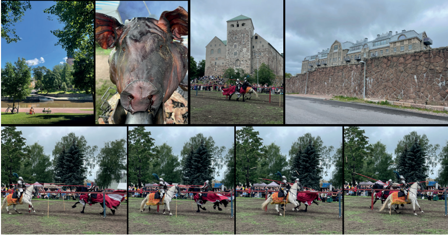
Kuva 6. Turku, sen linna ja linnan keskiaikamarkkinat turnajaisineen tarjosivat viihdykettä kaikille aisteille.