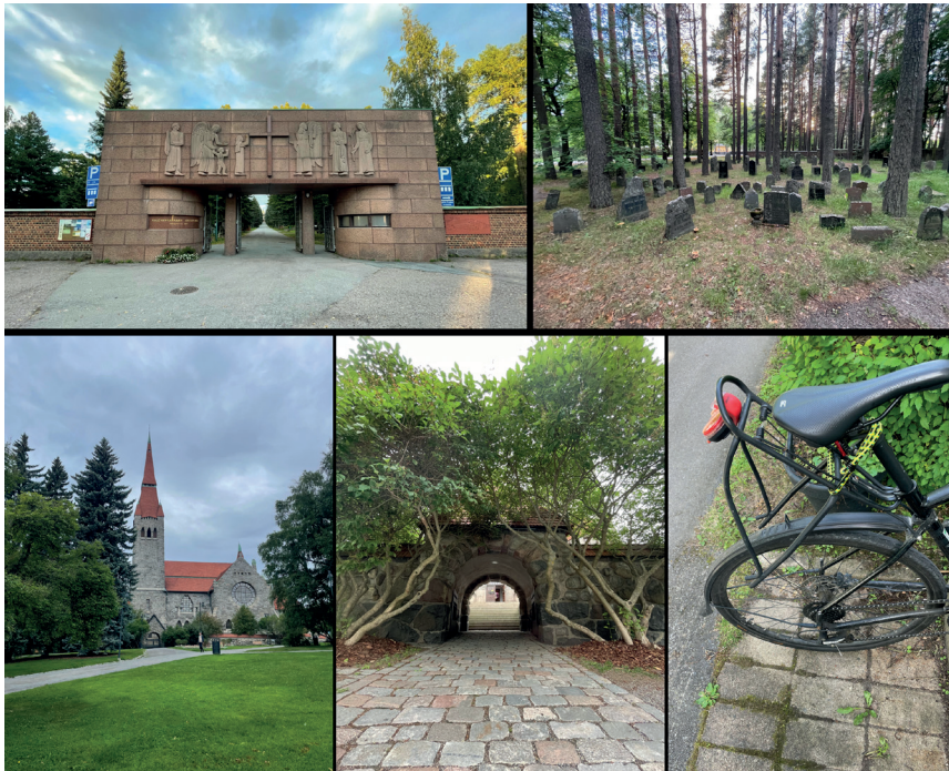
Kuva 7. Junamatkani taukosi vielä Tampereella, missä täytyi vielä suorittaa joitain turistimatkailijan manööverejä. Kalevan hautausmaalla on tulkintani mukaan hylättyjen hautakivien osasto, joka on sangen mielenkiintoinen. Pyörään omin pienin kätösini asennettu tarakka meni vaihtoon kotipihalle päästyäni.