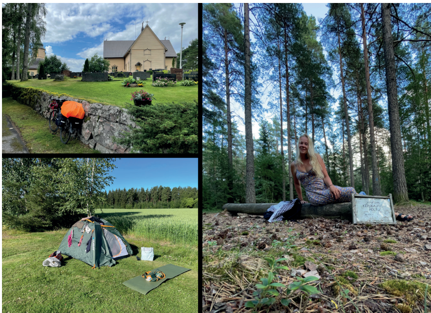
Kuva 4. Matka Liettoon sisälsi pysähdyksen Auran kirkolla. Perillä täytyi pestä pyykkiä. Vallitsevat sääolot esimerkiksi Maarian Jäkärälän kivikauden polun alkupisteellä olivat hikiset.

Seuraavan päivän etappi kohti Turkua kulki sekä Ristinpellon että -mäen (kuva 5) kautta. Ristinpellon rautakaudelta keskiajalle käytössä ollut kalmisto sijaitsee Liedossa käytännössä yksityispihalla. Tämänkin kohteen tutkimushistoria on yli satavuotinen ja sen 154 tutkittua ruumishautaa tulkittu vaikutteiltaan kristillisiksi. Kaikeksi onneksi paikalle on tosiaan pystytetty risti, sillä