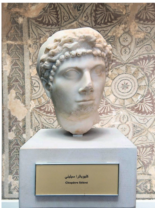
Kuva 1. Kleopatra Selene II. 5 Veistos sijaitsee Cherrhell-museossa, Algeriassa. Wikimedia Commons/Hichem Algerino 2020.

Materiaalinen kulttuurin myötä Kleopatra Selenestä on säilynyt jotain tietoa. Hänestä on muutamia mahdollisia muotokuvia esineissä (kuvaliite, kuvat 1, 3 ja 18), etenkin kolikoissa (esim. s. 209, 252), joskin lähes kaikista kuvista on olemassa erilaisia tulkintoja esittävätkö ne Kleopatra Seleneä vai hänen äitiään. Mauretaniasta löydetty marmoriveistos (kuva 1.) on suurella todennäköisyydellä Kleopatra Selenen muotokuva hänen elämänsä loppupuolelta. (Ks. s. 209–210.)