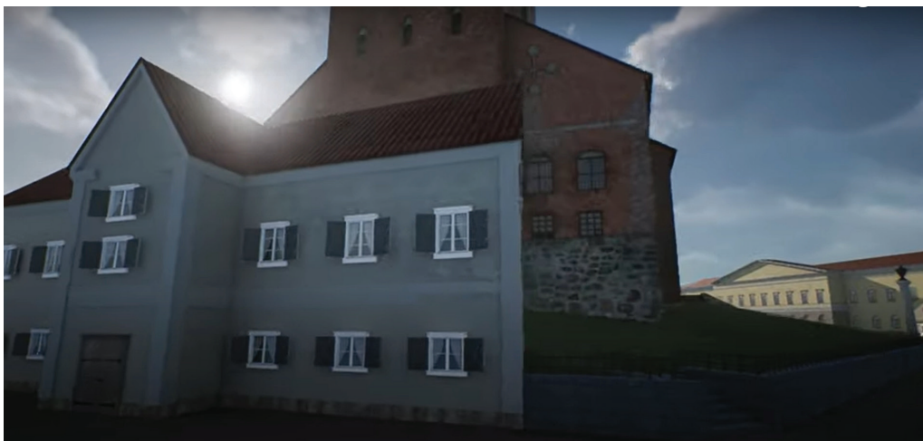
Kuva 1. Turun akatemian kirjaston rakennus tuomiokirkon edessä.

miten pääsee seuraamaan luentoja ja jopa soluttautumaan opiskelijabileisiin. Turun akatemiassa 1700-luvulla vaikuttaneet professorit ja tieteentekijät, kuten historioitsija, Suomen ensimmäisen sanomalehden perustaja ja Akatemian kirjaston pitkäaikainen hoitaja H. G. Porthan (1739–1804), kasvitieteilijä ja talousopin professori Pehr Kalm (1716–1779) ja luonnontieteilijä, taloustieteilijä ja kemisti Pehr Gadd (1727–1797) ovatkin ehkä tuon ajan turkulaisista tutuimpia nykyhetkestä saapuvalla matkaajalle.