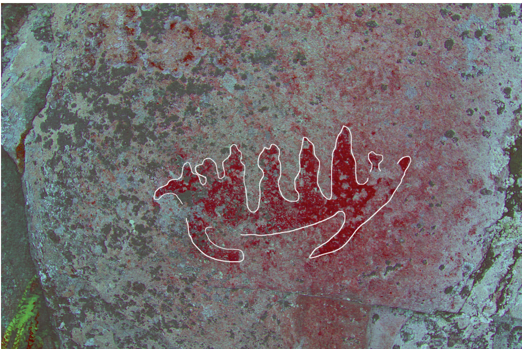
Kuva 4. Saraakallion veneen ja hirven yhdistelmä.