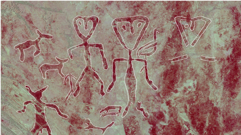
Kuva 1. Värikallion kolmiopäisiä hahmoja.

Värikalliolta on aikaisemmin tunnistettu kaksi kolmiopäistä ihmishahmoa. Löysin kuvia tutkiessani kolmannen vastavan hahmon (Kuva 1). Hahmoja on pidetty aiemmin miehinä jalkojen välin punaisuuden vuoksi, mutta voisiko kyseessä olla syntymään liittyvä tapahtuma? Yhden kolmiopäisen hahmon olkapäällä oleva lintu on tulkittu aikaisemmin joutseneksi, mutta pitkän jalkansa perusteella se voisi olla myös kurki. Muihin