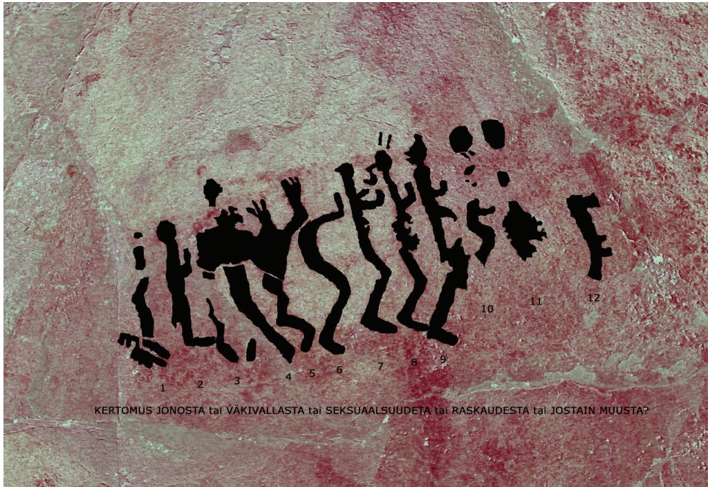
Kuva 3. Saraakallion jono-kuvio. Kuva ja kuvankäsittely: Pekka Honkakoski.

Projektiesittely: Kaksi vuotta kalliomaalausten kuvaamista: satakunta uutta kuvaa esiin kallioista