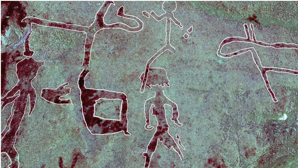
Kuva 5. Astuvansalmelta ennestään tunnettuja ja uusia kuvioita.

Pekka Honkakoski pekka.honkakoski@sll.fimnet.fi