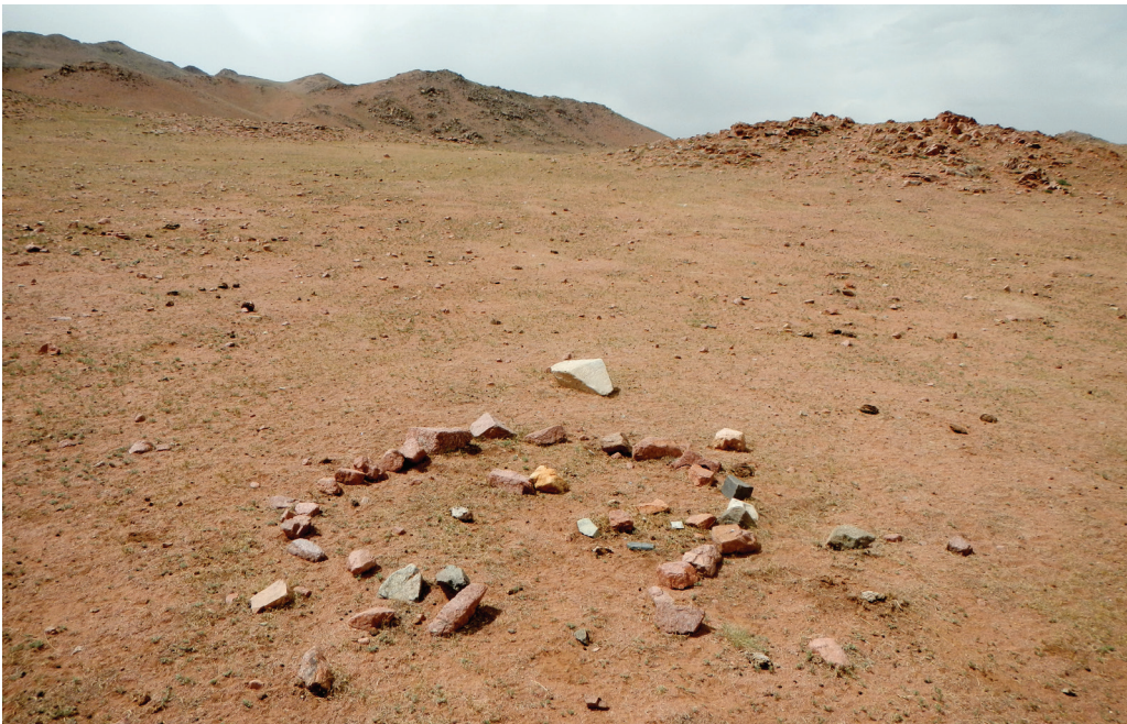
Kuva 2. Esimerkki kivistä maanpinnalle asetellusta lasten leikkijurtasta Züüinkhangain laaksossa. Rakenteen halkaisija on n. 2,5 metriä.