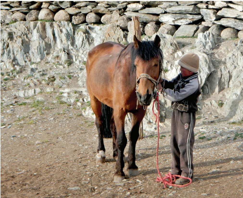
Kuva 5. Kahdeksanvuotias mongolialaispoika valjastaa hevosta paimeneen lähtiessään.

leikin kautta oppimisen merkityksen, samaan tapaan kuin ”tuottamattomien” vanhusten elämäkokemuksen tuoma yhteiskunnallinen panos helposti unohdetaan oikeistolaisimmissa tuottavuuskuvitelmissa. Nämä näkemykset hapertuvat toivottavasti omaan mahdolluuteensa nykyisessä vauhdilla muuttuvassa maailmantilanteessa, samoin kuin nopeasti vanhentuneet heitot siitä, kuinka ”[m]ikään ei silti horjuta homo (sic) sapiensin asemaa luonnon voittoisana valtiaana” (Ehrnrooth 2019). Yhteiskuntatieteiden ja etnologian puolella lapsia, vanhuksia ja muita marginaalisia ryhmiä on tarkasteltu jo huomattavasti pidempään ja laajemmin kuin arkeologiassa (esim. Keith 1980; Koskinen-Koivisto 2014;