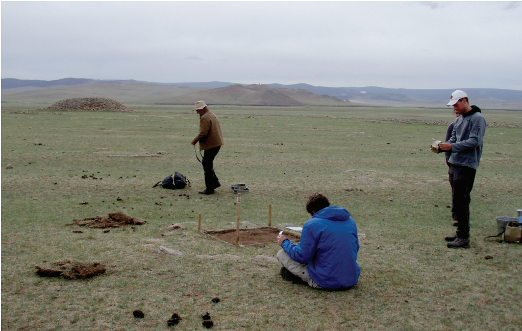
Kuva 1. Pronssikautista kivikehää tutkitaan Khanuyn laaksossa Mongolian suurimman khirigsuur-monumentin yhteydessä. Kivikehän halkaisija on n. 2,2 metriä (Kuva: Oula Seitsonen 2010).