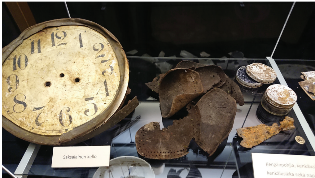
Kuva 4. Pienoisnäyttelyn vitriineihin asetettiin rakennusmateriaalien ohella roskakuopista tehtyjä näyttävämpiä esinelöytöjä.

Arkeologialla on paljon tarjottavaa lukion uuden opetussuunnitelman puitteissa. Opetussuunnitelmassa korostuva ilmiöoppiminen suuntaa opetusta oppilaslähtöiseen oppimi-