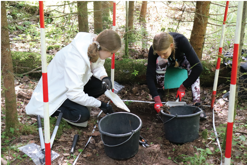
Kuva 1. Porin suomalaisen yhteislyseon lukiolaiset kaivamassa parakin paikkaa.

Vaikka kurssin tavoitteet olivat ensisijaisesti pedagogisia ja yhteisöarkeologisia, täydensivät löytöaineisto ja muut kaivaustulokset osaltaan Porin lentokentän historiaan keskittyvän Feldluftpark Pori -tutkimushankkeen tutkimusaineistoa (Väisänen 2020).