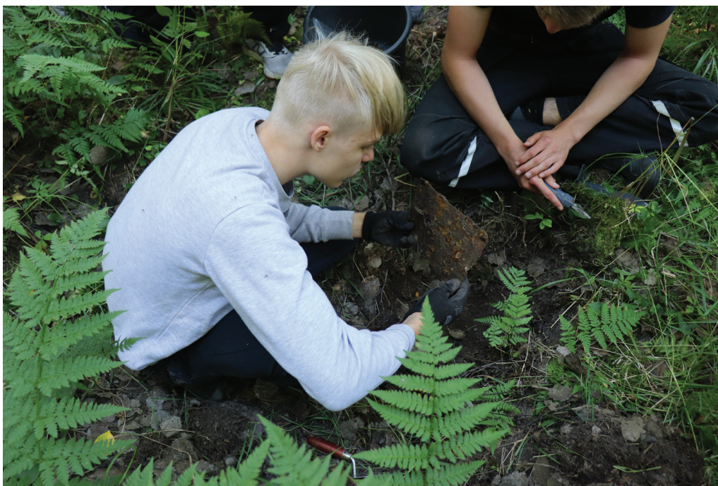
Kuva 3. Koekuopasta nostettiin saksankielinen kyltti, joka paljastui boilerin käyttöohjeeksi.

Opiskelijoita varten avattiin pitkänomainen, 2 x 6 metrin kokoinen kaivausalue, jota kaivettiin tasokaivauksena. Kaivamisen ohella opiskelijat osallistuivat kaivausalueen vaaitsemiseen ja valokuvaamiseen. Koska rakennuksen paikalla löytöaineisto oli varsin pinnassa, suuri osa kaivausalueesta saatiin tutkittua loppuun jo toisena kaivauspäivänä. Löytöaineisto koostui suureksi osin rakennusmateriaaleista, mutta joukossa oli myös keramiikka-astioiden palasia, pullolasia sekä nappeja. Viimeisenä kaivauspäivänä opiskelijat paikansivat sodan aikaisia roskakuoppia kaivamalla pieniä koekuoppia metallinpaljastimen antamien signaalien perusteella (Kuva 3). Yksi näin löydetty kohde päättyi tutkittavaksi myöhemmin Porin seudun kansalaisopistossa järjestetyllä yleisökaivauksella.