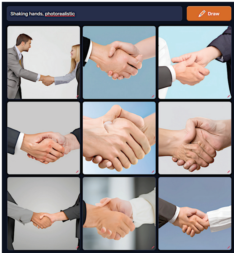
Kuva 3. Craiyyon-tekoälykuvageneraattorin (aiemmin DALL-E mini) hämmentävän fotorealistisia näkemyksiä käsittelemisestä.

Tekoälyllä tuotettujen kirjallisten ja kuvallisten tekeleiden taiteellisesta tasosta voi olla montaa mieltä, kuten taiteesta yleensäkin. Tekstisisältö on toistaiseksi usein suurelta osin jonkinlaista AI-nonsenseä (onkohan se jo oma taiteenlajinsa?) ja kuvataidekin on monesti varsin omaperäistä. Erityisesti ihmisten kuvaaminen on tuottanut tekoälylle tuskia, eikä kymmensormijärjestelmä rajoita sen käsityksiä fotorealismista (kuva 3). Nähtäväksi jää, miten