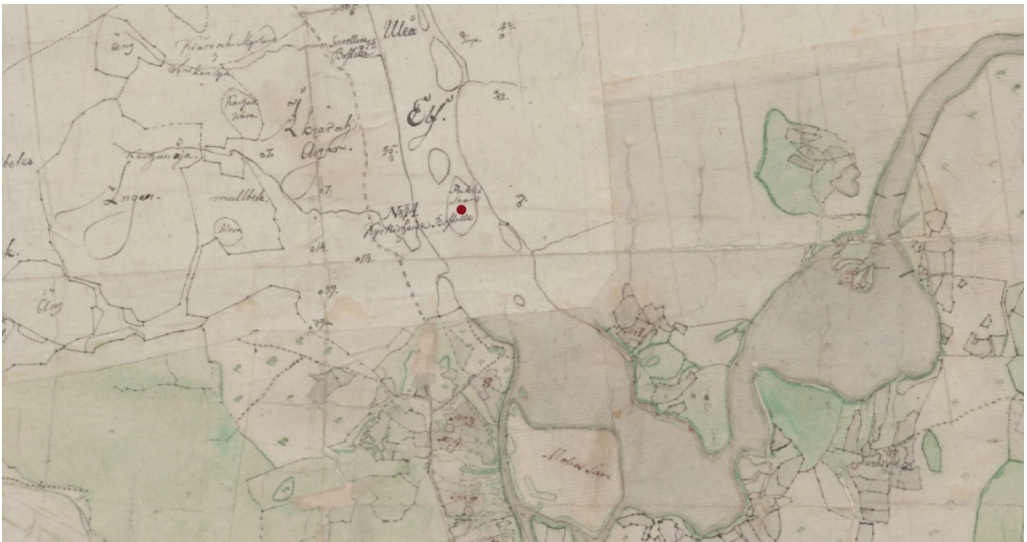
Kuva 1. Pukkisaari merkittynä vuoden 1773 Haxellin karttaan. Pukkisaaren vieressä, joen toisella rannalla näkyy merkittynä kirkkoherran asuinsija, talo NO 34 (kartta: MH: MH 131/- -, muokkaus: M. Kuusisto).

Ymmärtääksemme paremmin teloitusten ja teloituspaikkojen merkitystä yhteisölle, on aiheellista tutustua lyhyesti kuolemanrangaistuksen historiaan Suomessa. Tutkitulla ajanjaksolla voidaan teloittaminen rangaistuksena vakavasta rikoksesta kytkä kristillisessä kon-