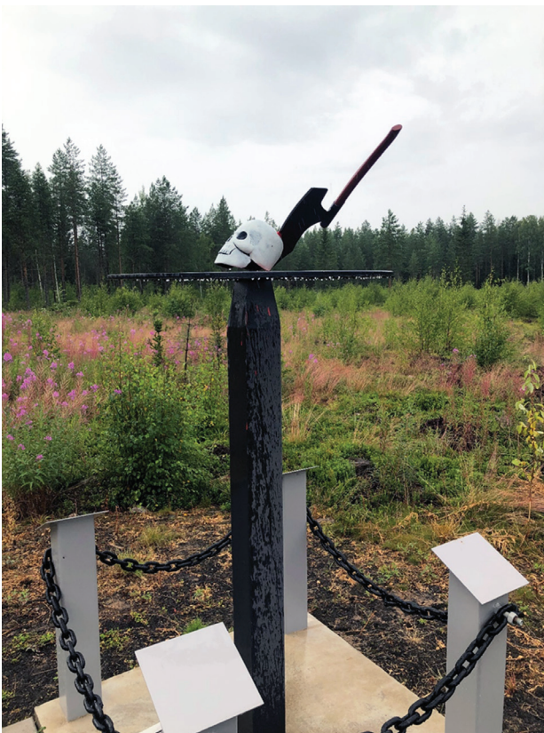
Kuva 3. Teirikankaan Mestauspatsas.