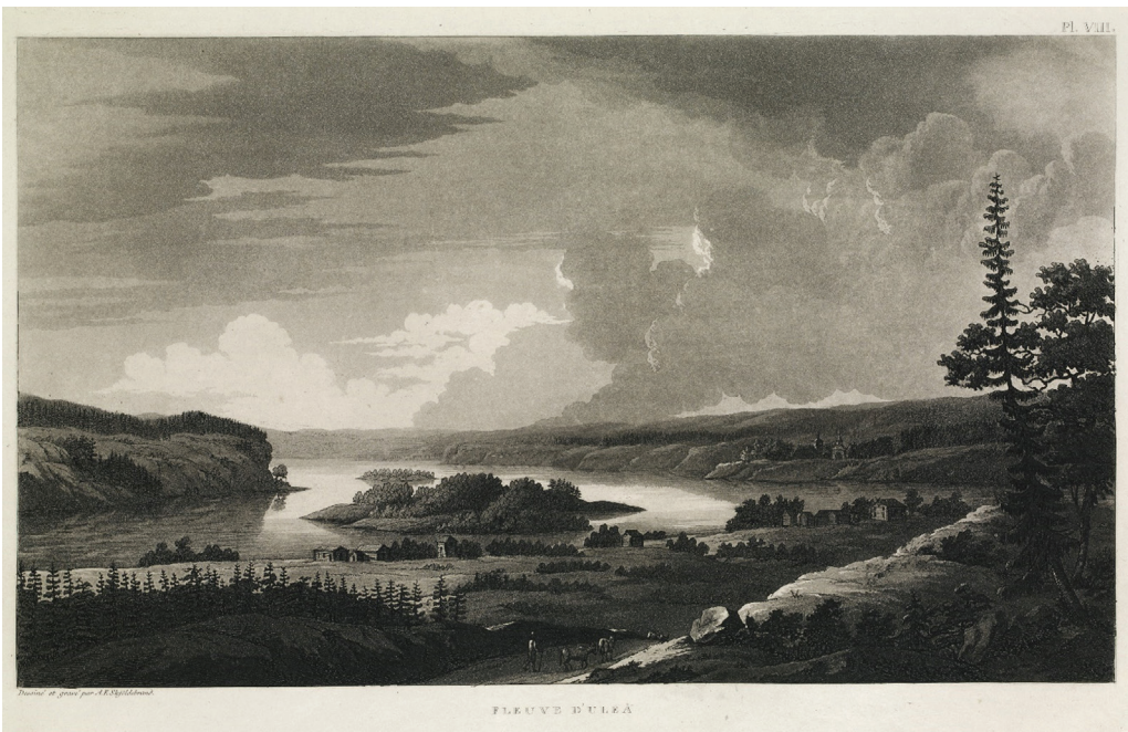
Kuva 5. A. F. Skjöldebrandin teoksessa Voyage Pittoresque au Cap Nord esiintyvä piirros Muhokselta 1799 vuodelta. Etualalla näkyy Muhoksen pappila ja keskellä kuvaa Oulujoessa näin ollen Pukkisaari/Rovastinsaari (piirros: Skjöldebrand 1801).

Vaikka on viitteitä, että teloituspaikkaa voitiin siirtää tilanteen mukaan (Moilanen 2021: 265), ei Muhoksella paikkaa kuitenkaan vaihdettu tuon tuosta. Teilikankaalla vuonna 1776 teloitettu Erkki Pekanpoika Kärnä (Kekkonen) oli myös kotoisin Laitasaaren kylästä, mutta häntä ei teloitettu Pukkisaaresa. On mahdollista, että Teilikankaan vakiintumista teloituspaikaksi edesauttoi maanteiden muuttuva merkitys yhteisölle, sillä niiden merkitys Pohjanmaalla alkoi läpi 1700-luvun nousta jokiliikenteen edelle (ks. esim. Toivo 1997: 160–173). Vuonna 1764 teloitettu Pekka Lehtola sai osakseen teilaamisen, jolloin sijainti maantien varrella oli erityisen tärkeä. Maanteiden varsilla teloitusrakennelmat sijoitettiin noin 10–15 metrin päähän tiestä, ettei näky jäisi yhdeltäkään tiestä matkustavalta huomaamatta (Moilanen 2021: 264).