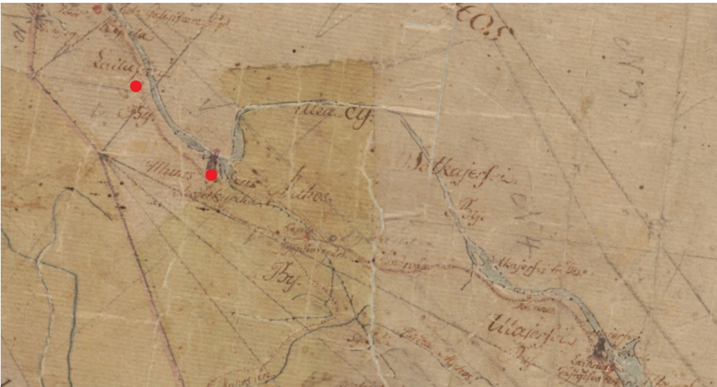
Kuva 4. Laitasaaren kylä merkittynä vuoden 1786 Oulun läänin rajakarttaan. Kuvaan merkitty myös kirkon paikka (kartta: MH: MH 154/- -, muokkaus: M. Kuusisto).

Nykyisin Rovastinsaarena tunnettu entinen Pukkisaari sijaitsee Muhoksella Oulujoen sivujoen, Muhosjoen keskellä. Tänä päivänä Rovastinsaari on merkitty yhdessä läheisen Kestisaaren kanssa Oulun seudun yleiskaavaan niin maisema- kuin luontokohteena, jonka ohi kulkee veneväylä (Oulun seudun yleiskaava 2020, teemakartta 1). Rakennuskantaa saarella ei juuri ole ja luontoinventoinnin mukaan sen sisäosassa tavataan merkkejä menneestä laidunkulttuurista ja peltomaisemasta (Kukko-Oja 1991: 2). Rovastinsaaren laiduntamisesta saa viitteitä myös vanhojen lehtijulkaisujen sivuilta, sillä ainakin kolmena vuotena peräkkäin, vuosina 1935–1937, on Liitto -lehdessä ilmoitus Oulujoen Rovastinsaaren laiduntamishuutokaupasta. Saaren on ilmoitettu sopivan hyvin karja- ja hevoslaiduntaan ja sen on mainittu olevan Oulujoen pappilan omistuksessa 3 ( Liitto 1935, no 141: 8; Liitto 1936, no. 124: 6; Liitto 1937, no. 120: 5).