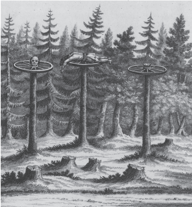
Kuva 6. E.D. Clarcken piirros teilauksesta Siikajoelta (piirros: Clarke 1819).

”Pysähdyimme muutamaksi toviksi tekemään luonnosta tästä kaameasta speaktaakkelista.