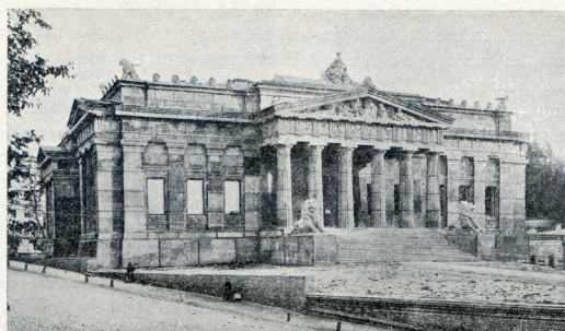
Fig. 1. Musée Historique d'Ukraine dit de Chevtchenko à Kiev.