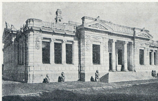
Fig. 2. Musée d'Ékatérinoslav.

Kuva 1. Kiovan ja Jekaterinoslavin (nyk. Dnipron) museot Tallgrenin teoksen kuvituksessa. Tallgren 1926: Fig. 1, 2.