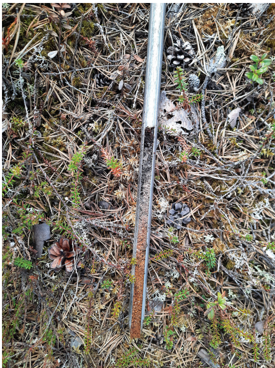
Kuva 2. Kairanäyte tarhan urasta.