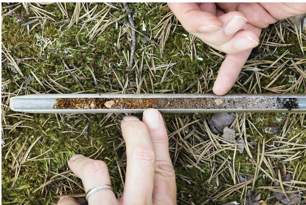
Kuva 3. Kairanäyte tarhan kannaksesta, huuhtoutumiskerroksen alla oleva sekoittuneelta vaikuttava kerros on sormien välissä.