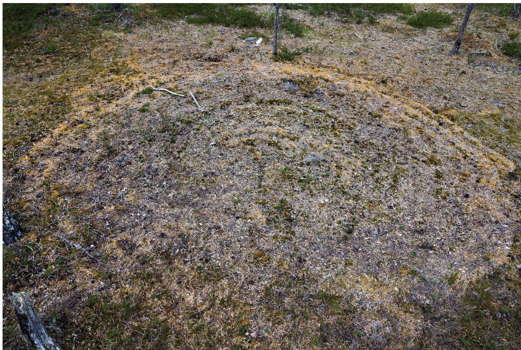
Kuva 1. Jatulintarha. Kuvan kontrasteja on säädetty, jotta tarha näkyy paremmin.

Kohteen havaitseminen on erittäin hankalaa, mikäli ei tiedä tarkkaan mitä etsiä. Syksyllä 2021 lähetetyssä kuvassa tarha erottui erittäin hyvin, koska kuva oli otettu pilvisen syys sään vallitessa, jolloin olosuhteet toivat kohteen hyvin esille. Kuvasta vaikutti myös siltä, että kohde olisi mahdollisesti tehty kivistä, jotka olisivat olleet täysin sammalen peittämiä.