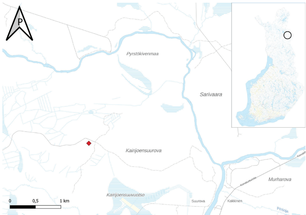
Kartta 1. Kohde kartalla.

Kohteen kivettämyys varmistettiin vielä poistamalla varovaisesti pintaturvetta jatulintarhan kohdalta noin 10 x 20 cm alueelta, jolloin esille saatiin sekä osa kannasta että uraa. Esille tuli tasainen huuhtoutumiskerros, mutta kiviä ei havaittu.